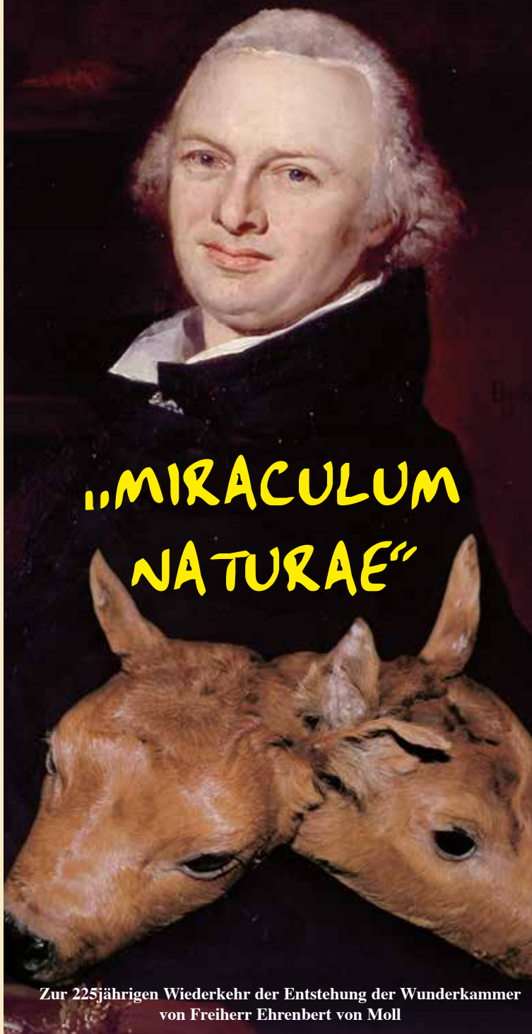
Zur 225jährigen Wiederkehr der Entstehung der Wunderkammer von Freiherr Ehrenbert von Moll